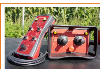
Télécommande de série Radiocommande en option

Photos Indicatives et non contractuelles