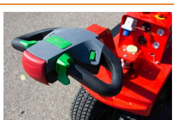
Timon et poignées de commande ergonomiques