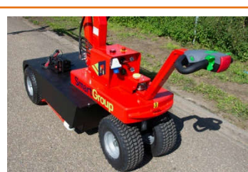
Châssis avec Stabilisateurs et Roues Tout terrain