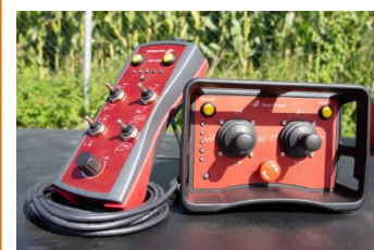
Télécommande de série Radiocommande en option