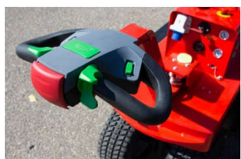
Timon et poignées de commande ergonomiques