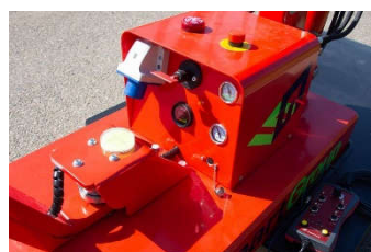
Unité centrale regroupant les fonctions d'aspiration