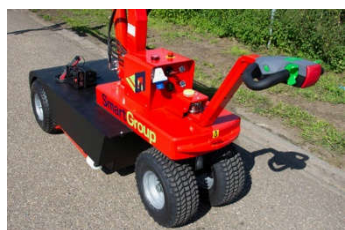
Châssis avec Stabilisateurs et Roues Tout terrain